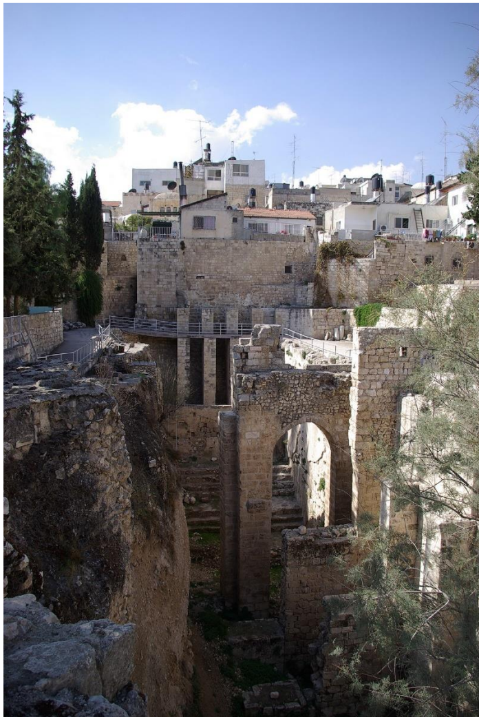
Het bad van Betzata Johannes 5 vers 2 (Bethesda / Jeruzalem)